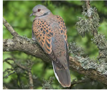
Flügel und Rücken lebhaft gemustert