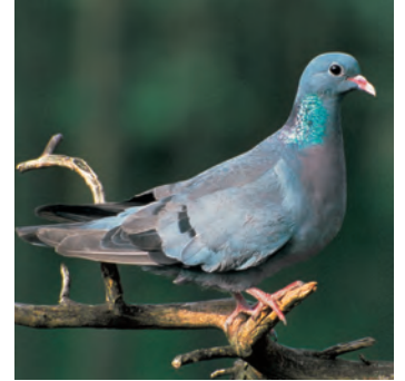
Hohltaube Grösse: 32-34cm ohne helle Polster an der Nasenöffnung