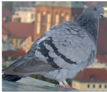
oft deutliche Streifen im Flügel