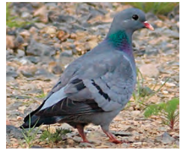
grauer Bürzel, Streifen im Flügel kaum sichtbar, keine weissen Streifen