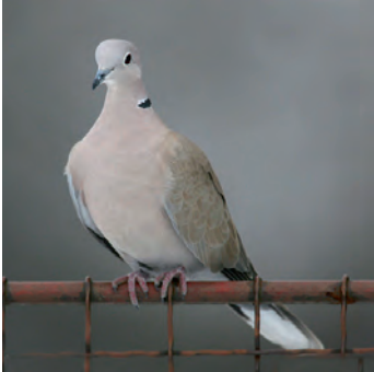
Türkentaube Grösse: 31-33cm