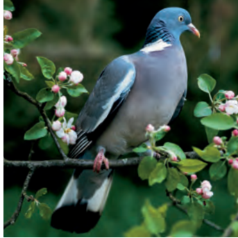
Ringeltaube Grösse: 40-42cm