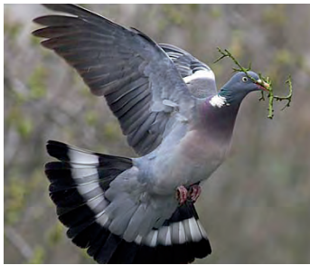
weisses Band an Hals Oberflügel und Schwanz