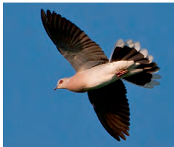
schwarze Mittelfedern am Schwanz