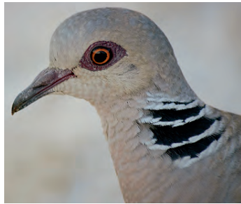
Streifen am Hals als Merkmal