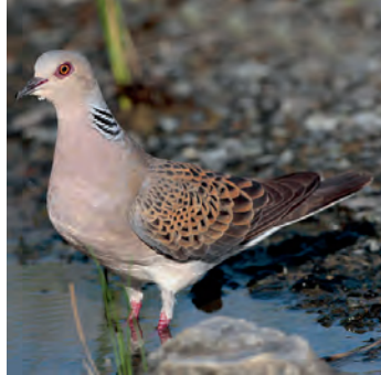
Turteltaube Grösse: 26-28cm