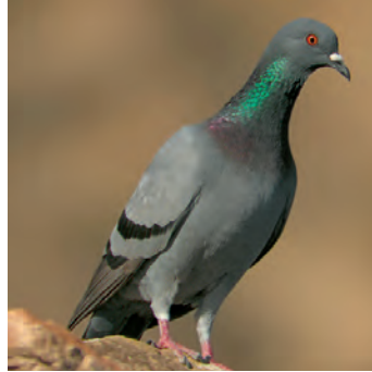
Haustaube Grösse: 31-34cm