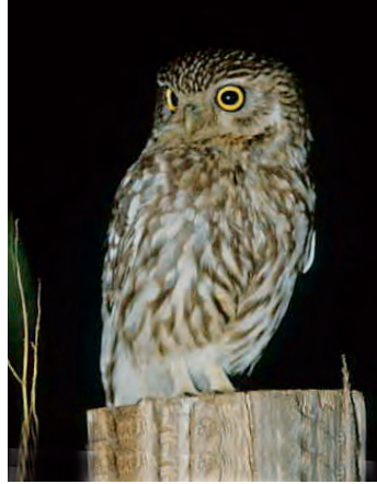
Steinkauz Länge: 21 bis 23 cm klein, leicht grösser als eine Amsel