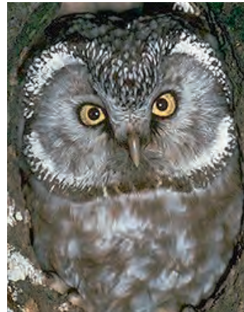
Rauhfußkauz Iris: gelb eckiger Gesichtsschleier