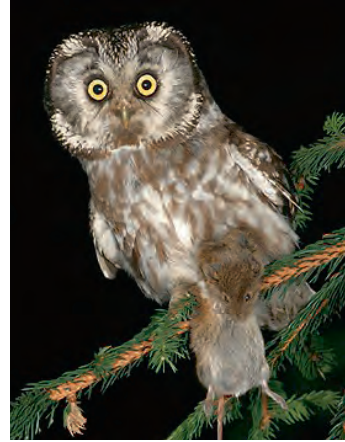
Rauhfußkauz Länge: 24 bis 26 cm gedrungen, rundlich