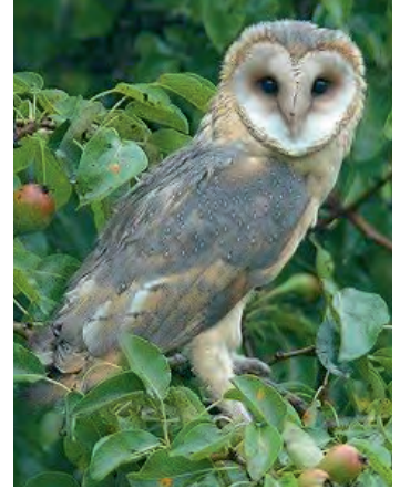
Schleiereule Länge: 34 cm schlank, elegant fast weisser Bauch