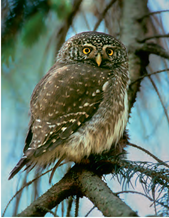
Sperlingskauz Länge: 16 bis 19 cm klein, etwa wie ein Star