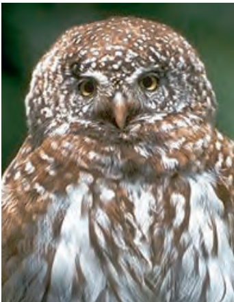
Sperlingskauz Iris: gelb